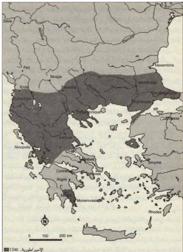
الشكل (4) الإمبراطورية عام 1340